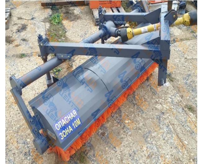
МК-4.1 (МК-454) облегченная конструкция, сварной корпус редуктора