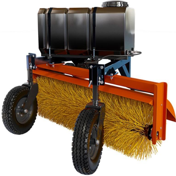
Щетка коммунальная БЗ-22.00.000 конструкция с двумя карданными валами