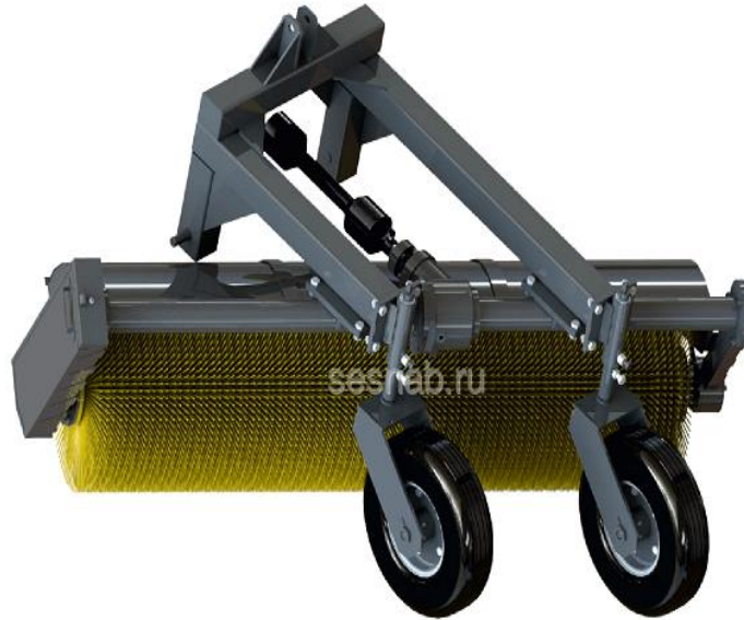
МК-2 советская разработка, прошедшая некоторую модернизацию